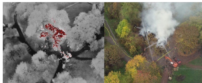
Luftaufnahme während eines Großbrandes

Deutsches Rotes Kreuz Ortsvereinigung Weiterode Freiherr-vom-Stein-Str. 7 36179 Bebra - Weiterode www.drohne-hefrof.de