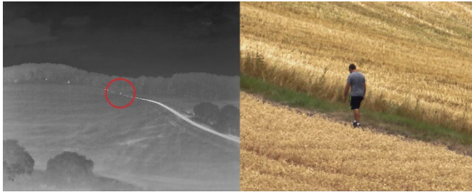
Wärmebild- und Zoomaufnahme einer Person in ca. 500m Entfernung