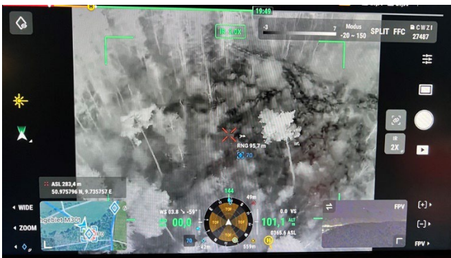
Nachtsichtaufnahme zum Beispiel bei der Suche von Personen